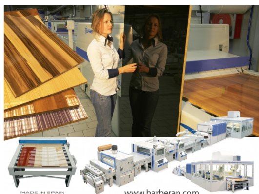
Maquinaria para acabado en alto brillo y mate sobre melamina.