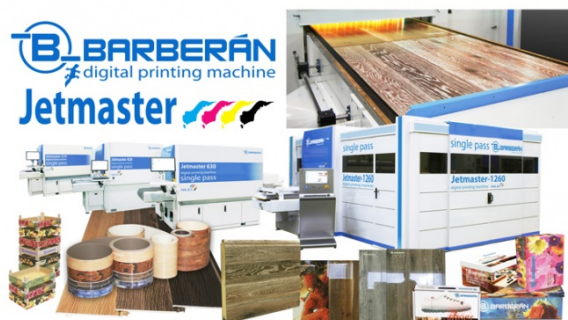
IMPRESORAS DIGITALES SERIE JETMASTER